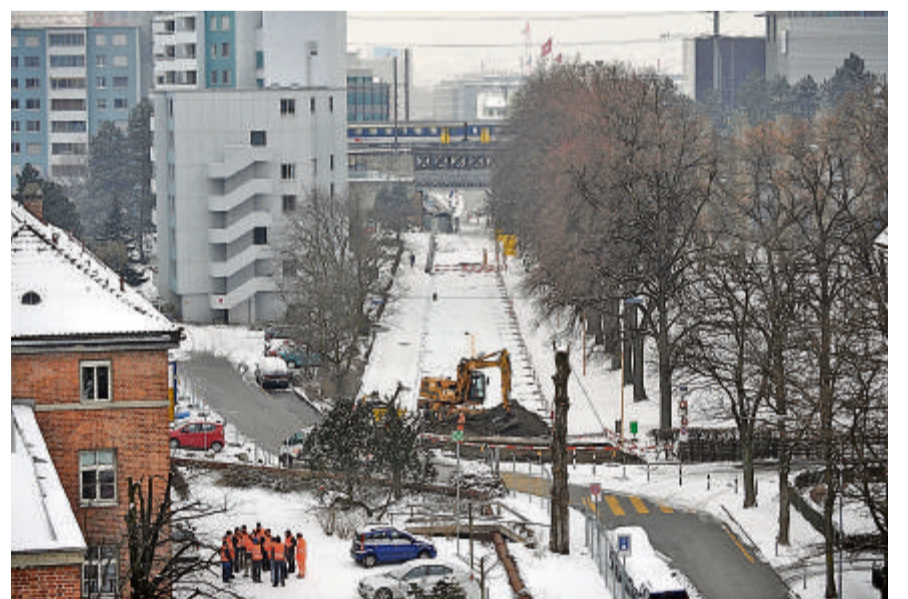
Ein halbes Jahr dauern die Sanierungsarbeiten an der Neugasse.

Die Arbeiten dauern voraussichtlich bis Ende Juli 2010. Während der Bauzeit führt eine Baupiste quer durch die Josefstrasse. Die Wiese, die Hecke und auch der Zaun werden jedoch laut Angaben des Tiefbauamtes wieder herge-